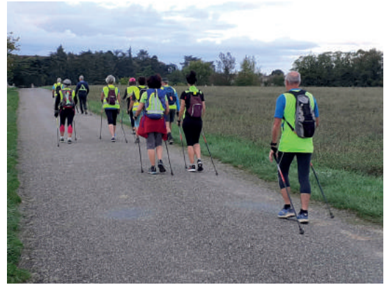
Les premières sorties de l'automne

A la veille des fêtes, les animateurs du jour ont concocté une sortie spéciale Noël conduisant le groupe sur un circuit très