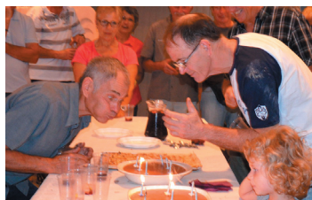
On en aura manqué des anniversaires et des pique-niques